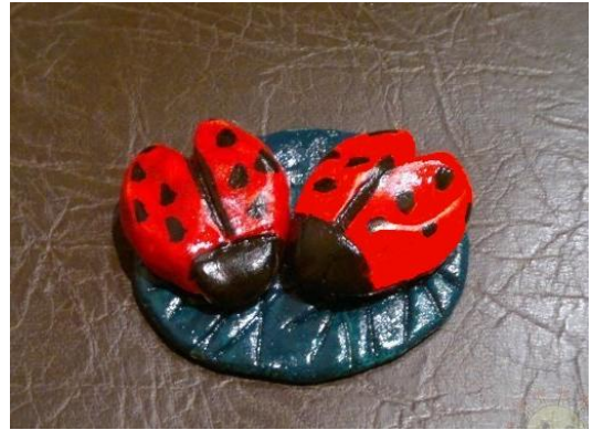
Поделки из бросового материала.