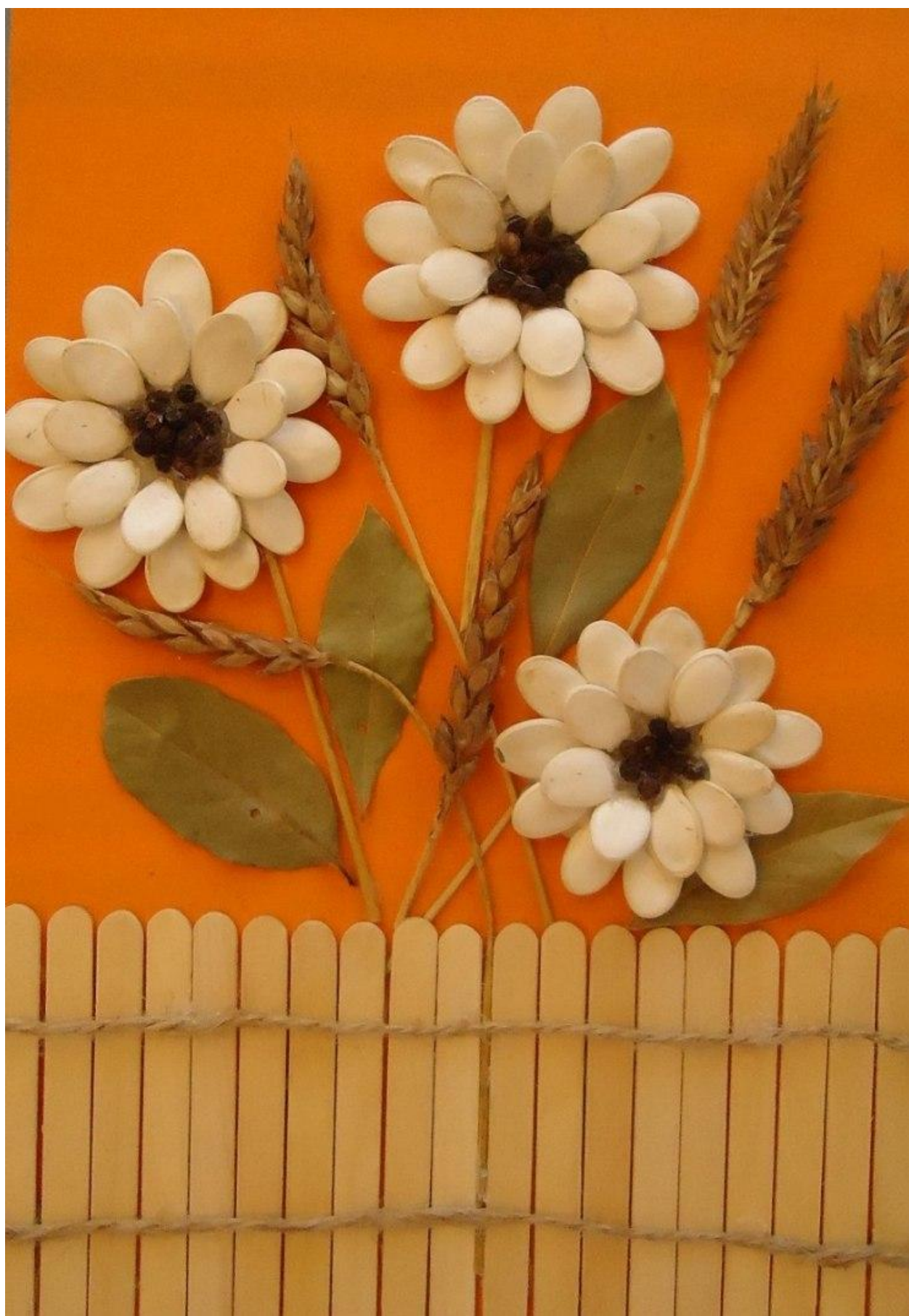
3. Основная часть.