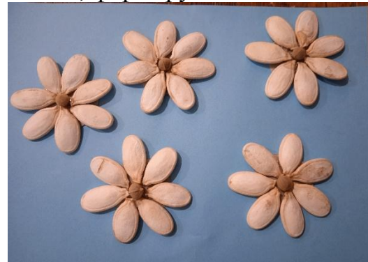
Так делаем 5 цветов.