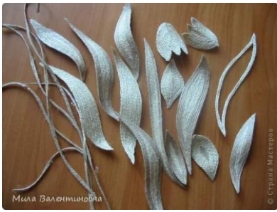
Части из джутовой нити.