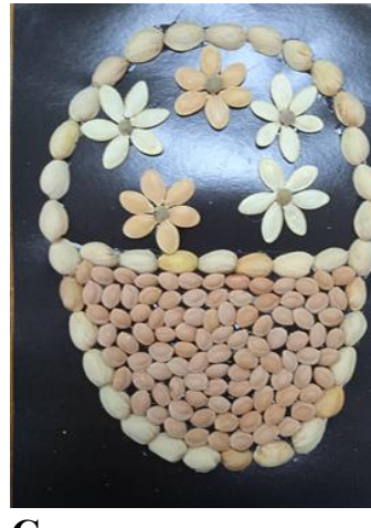
Серцевинку делаем из семян липы.