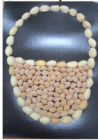
Заполняем корзинку косточками из ягод.