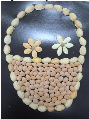
Формируем цветочки из семян тыквы.