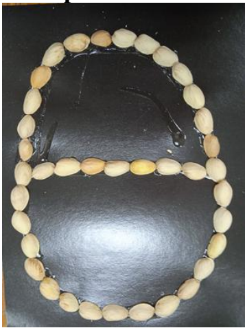
Выкладываем основу нашей корзинки фисташками.