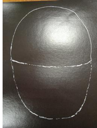
Делаем набросок нашей корзины.