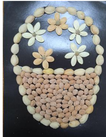
Серцевинку делаем из семян липы.