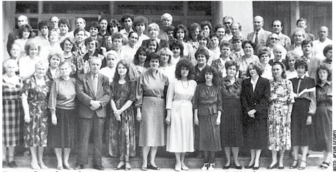
Коллектив Белгородского областного института усовершенствования учителей, 1994 год

Благодаря профессионализму, преданности своему делу, большому трудолюбию, таланту преподавателей, педагогов институт развивался, успешно выполняя свою главную миссию — повышать качество образования Белгородской области. Сегодня наш институт обладает высоким потенциалом, компетентным и работоспособным профессорско-преподавательским составом, который полон творческих планов и замыслов. Надеюсь, что всё это позволит нам эффективно реализовывать как региональные, так и федеральные инициативы. Желаю всем преподавателям и сотрудникам Белгородского института развития образования радости, профессиональных побед, счастья и любви близких, душевного равновесия, интересного и плодотворного учебного года!