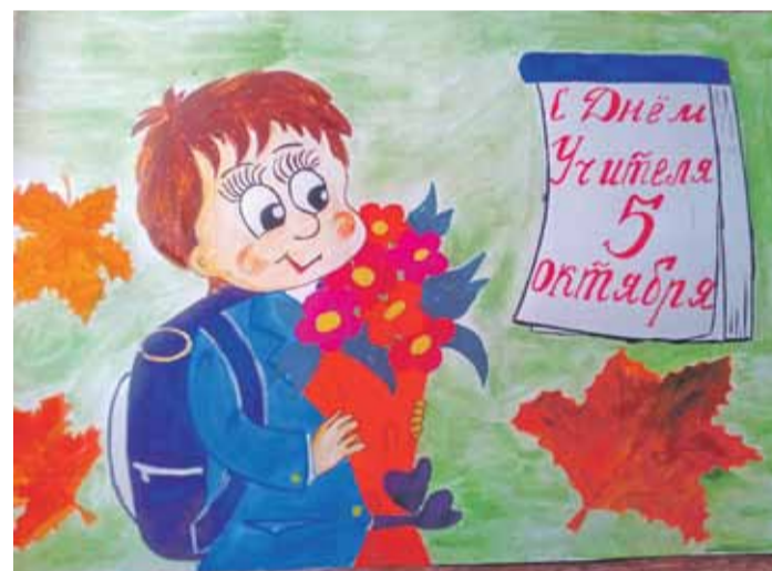
С ДНЁМ УЧИТЕЛЯ! Рисунок Валерии Шиловой (Пятницкая школа Волоконовского района)