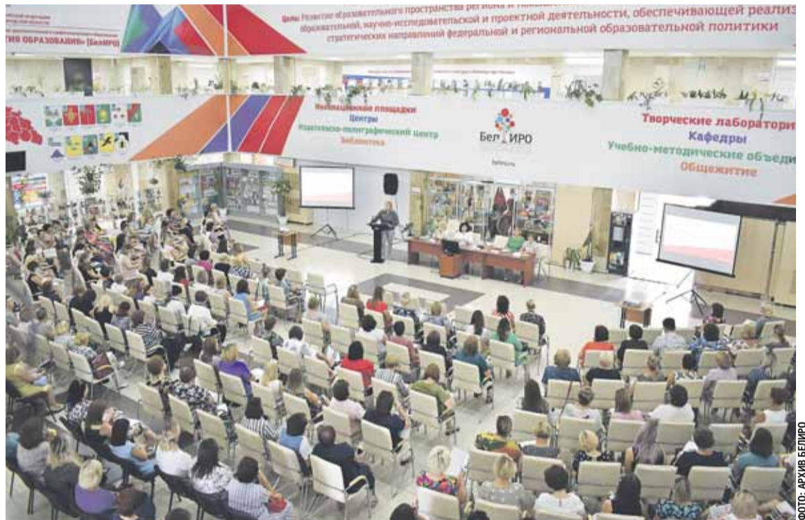
Современный, методически и технологически оснащённый центр непрерывного образования