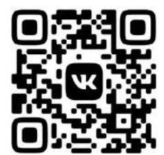
ПАБЛИК В СОЦСЕТИ «ВКОНТАКТЕ» HTTPS://VK.COM/KAFEDRA_DZOT

Созданная группа в соцсети позволит учителям физкультуры оперативно обмениваться лучшими практиками, делиться опытом регионов, конкретных образовательных учреждений.