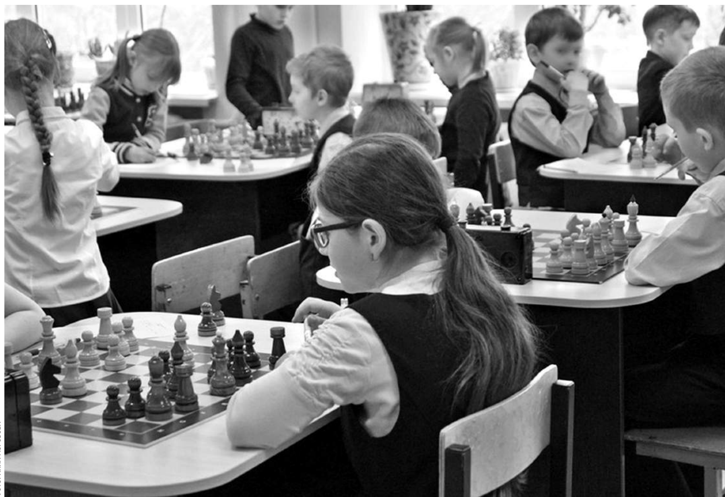
В образовательном комплексе «Луч»

— Высокий уровень локального нормотворчества. В этих учебных заведениях есть хорошо проработанные локальные нормативные акты, которые обеспечивают порядок. Основные образовательные программы и программы развития направлены на активное познание мира, развитие учебно-исследова-