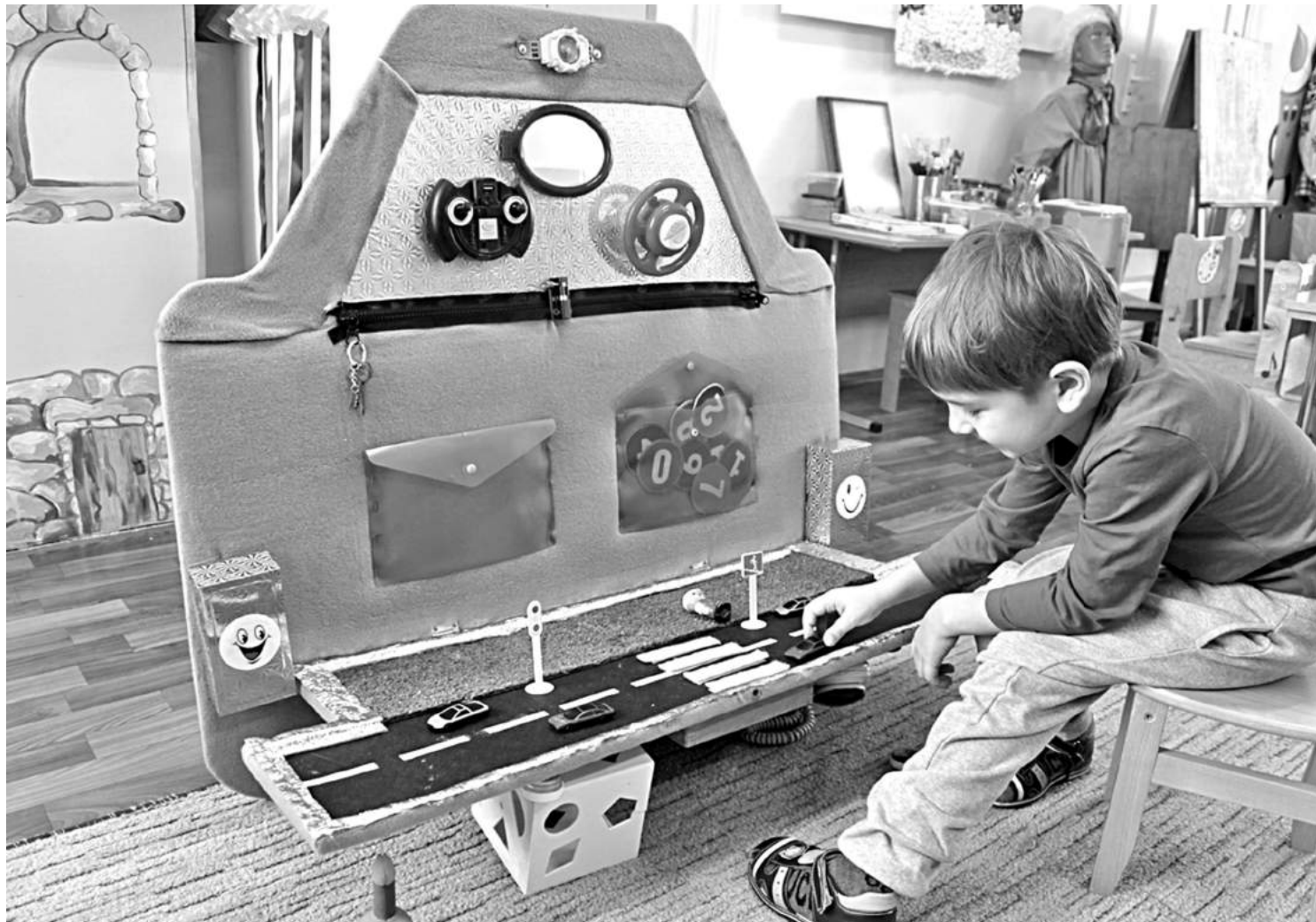
Игровая зона в детском саду № 8

СЕГОДНЯ СВОИМ ОПЫТОМ ДЕЛЯТСЯ УЧРЕЖДЕНИЯ ОБРАЗОВАНИЯ НОВООСКОЛЬСКОГО ГОРОДСКОГО ОКРУГА