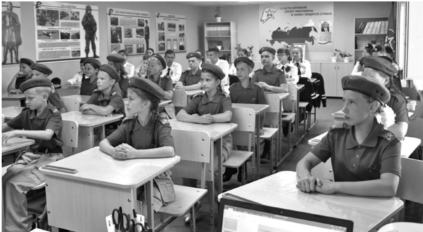
Кадетский класс школы № 1

В результате реализации проекта в школе создали лабораторию, которую можно без преувеличения назвать кузницей пытливых, талантливых юных исследователей. Ученики от четвёртого до выпускного классов занимаются наукой. В рамках постпроектной деятельности рядом с лабораторией оформлена развивающая зона «Химия занимательная и увлекательная», которая рассказывает об опытах,