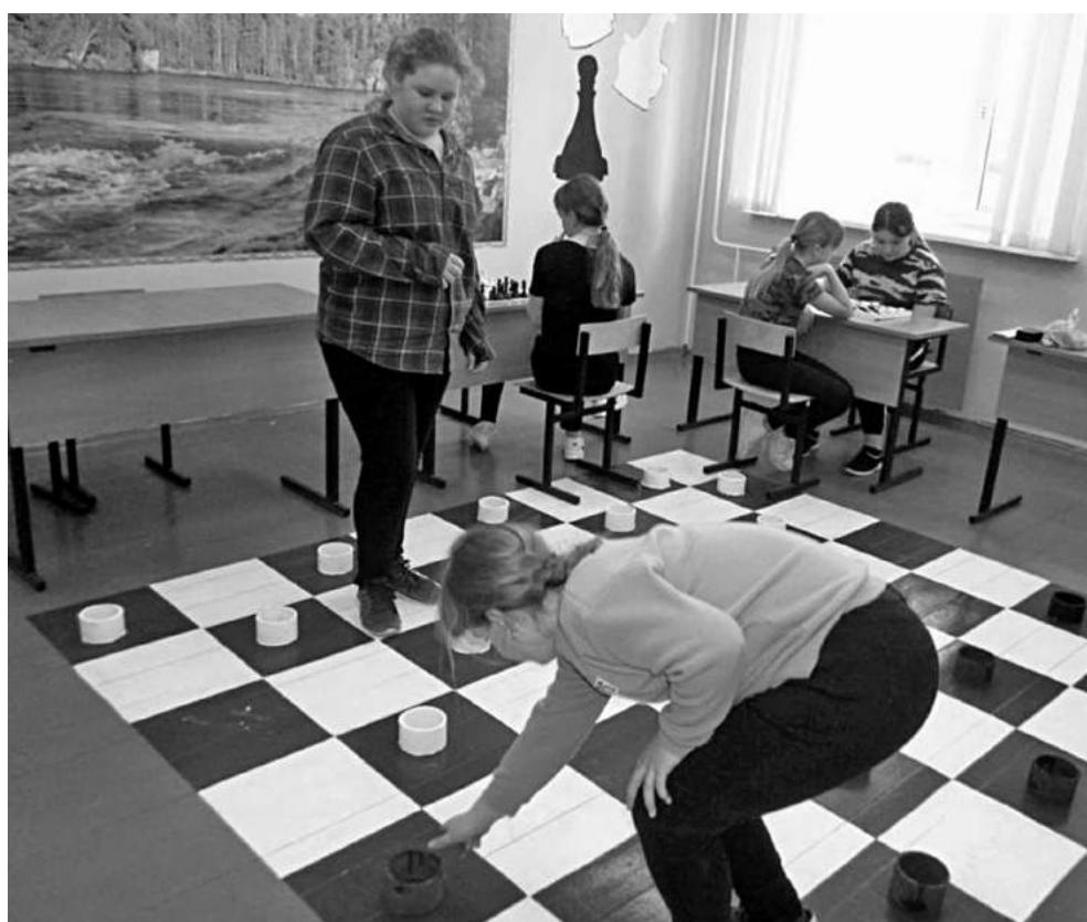
Игровая зона в Глинской школе