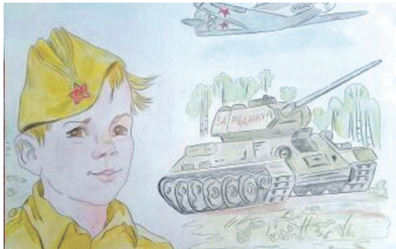
Рисунок Дарьи Лопиной (Корочанская школа им. Д. Кромского)