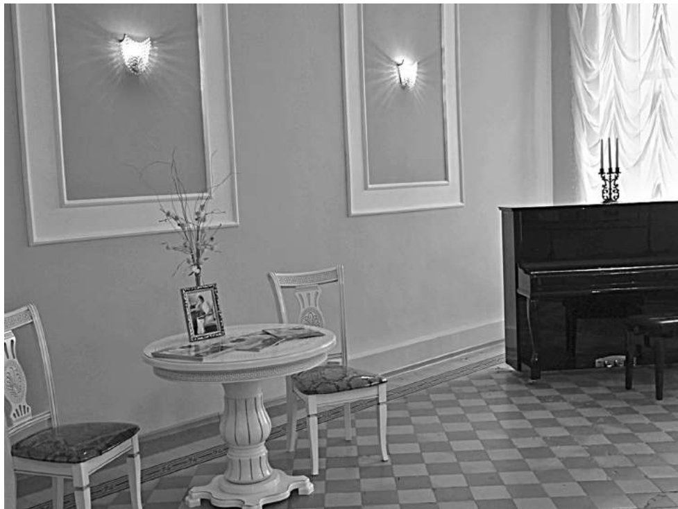
Ольгинский зал школы № 1