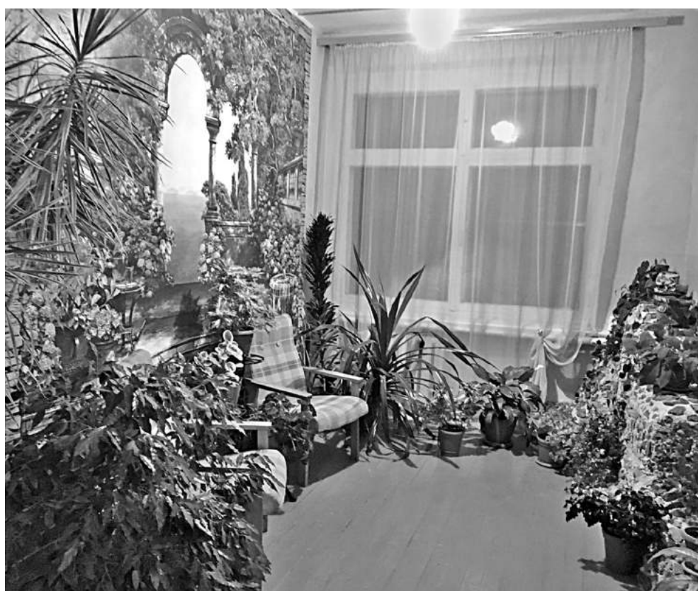
Зимний сад в Васильдольской школе