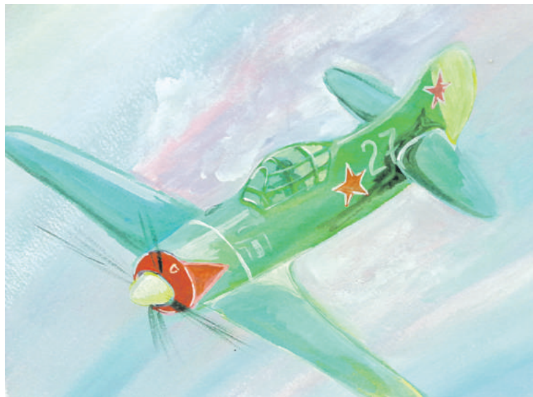
Воздушный бой. Рисунок Дмитрия Новикова (Корочанская школа им. Д. Кромского)