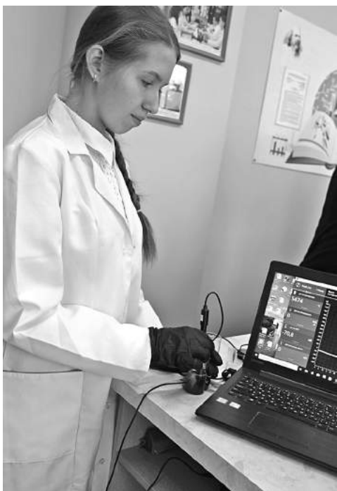
В школе № 1

КОЛЛЕГИ! МЫ ПРИГЛАШАЕМ ВАС СТАТЬ НЕ ТОЛЬКО ЧИТАТЕЛЯМИ, НО И АВТОРАМИ ГАЗЕТЫ!