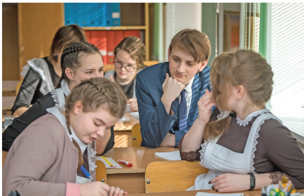
Урок обществознания в 10-м «Б» классе

Ольга МУШТАЕВА » ТЕКСТ