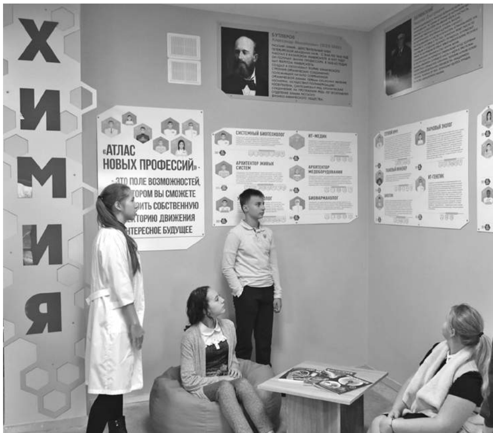
Профориентационная зона в школе № 1