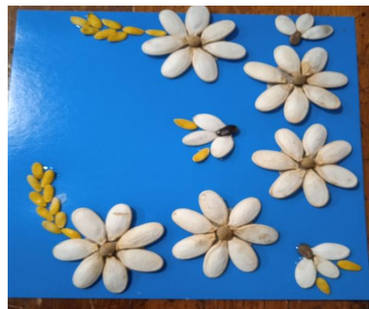
Начинаем добавлять другие семена и формировать наше панно.