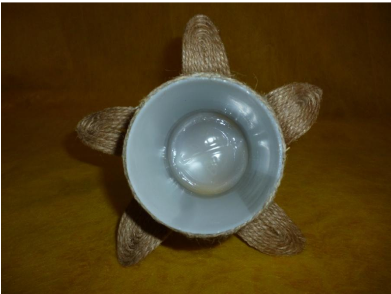
- У нас получилось сомкнуть круг пятью лепестками.