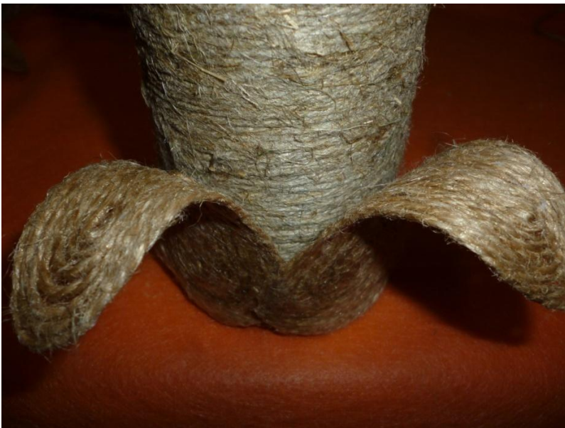
- Два лепестка...