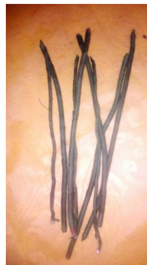
7. Проволоку обматываем тейп- лентой или гофрированной бумагой.