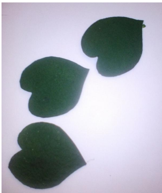
6. Красим их в зелёный цвет.