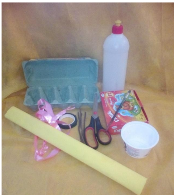
1. Материалы для поделки.