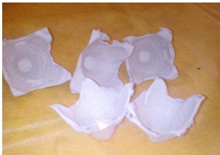
2. Разрезаем лотки.