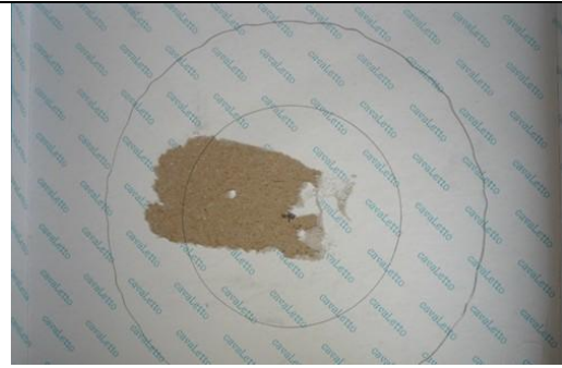
Подготовить основу из картона.