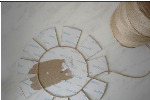
Закрываем шпагатом дно корзинки. Воспользуемся горячим клеем. Чтобы не ошибиться с центром, обматывать лучше с внешнего круга.