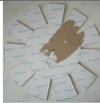
Между соседними сегментами оставляем небольшие расстояния, примерно, 5 мм. От трапеций обрезаем лишнее, чтобы получились прямоугольники,