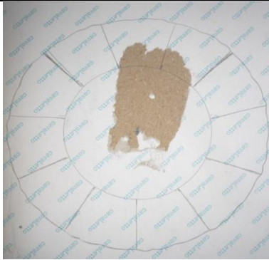
Число стенок корзинки должно быть обязательно нечетным.