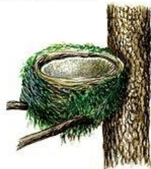
Гнездо певчего дрозда

Не делают настоящего гнезда птицы, выращивающие птенцов в дуплах и норах. Они довольствуются обычно небольшой подстилкой. В дуплах подстилкой может служить древесная труха. У зимородка подстилка в норе состоит из мелких костей и чешуек рыб. У щурки — из хитиновых остатков насекомых. Дятел обычно не занимает готовое дупло. Своим крепким клювом он выдалбливает себе новое дупло. Золотистая щурка примерно 10 дней роет клювом в мягкой глине обрыва полутора- и даже двухметровый ход, который завершается расширением — гнездовой камерой.