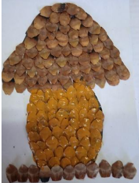
По й грибок.