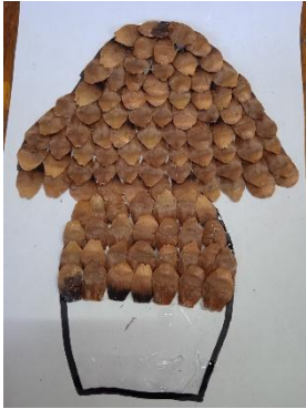
Обклеиваем ножку. Сверху вниз.