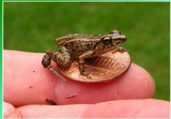
• Кубинский карлик