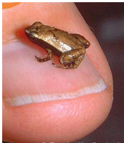
Лягушка зооглоссус Гарднера ( Sooglossus gardineri ). Взрослая особь не превышает в длину 11 миллиметров. В уязвимом состоянии.