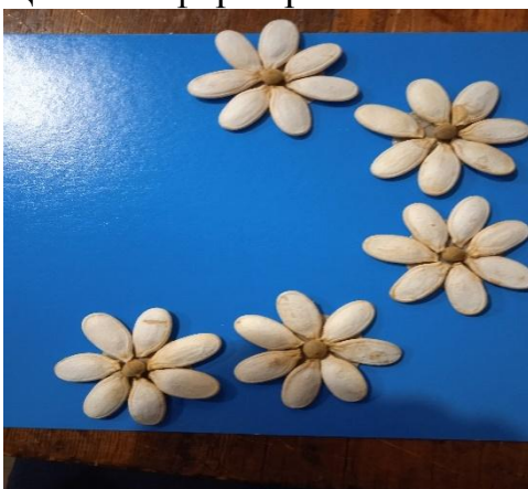
Вылаживаем цветы на основу и приклеиваем.