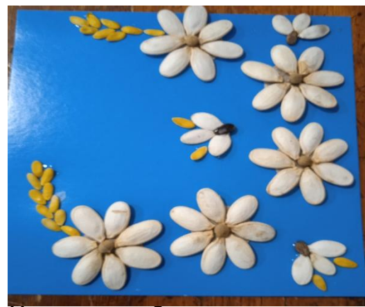
Начинаем добавлять другие семена и формировать наше панно.