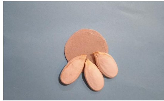
Приклеиваем на кружечки семена тыквы, формируя цветок.