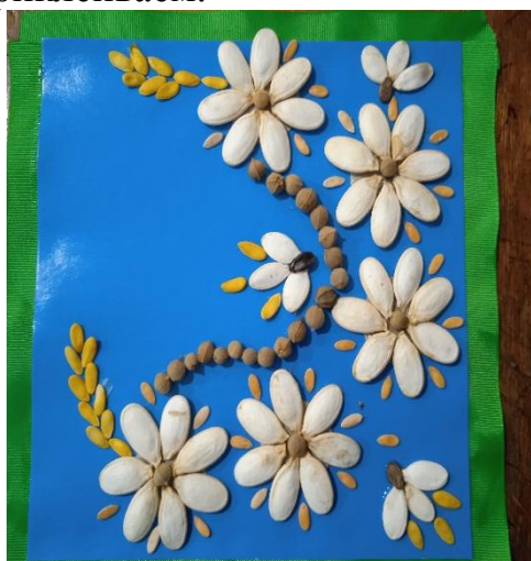
Вот такое панно у нас получилось. По желанию можно сделать рамку